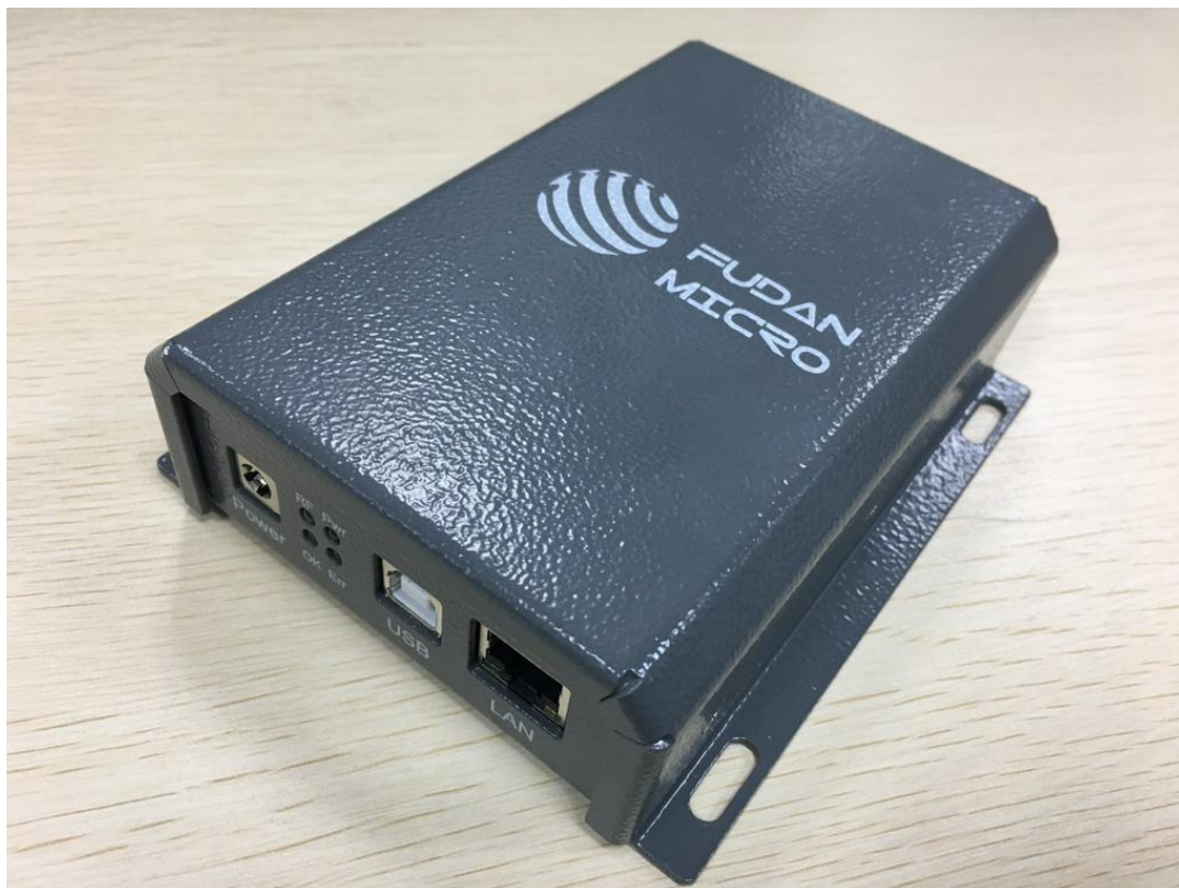
图 1 产品外形